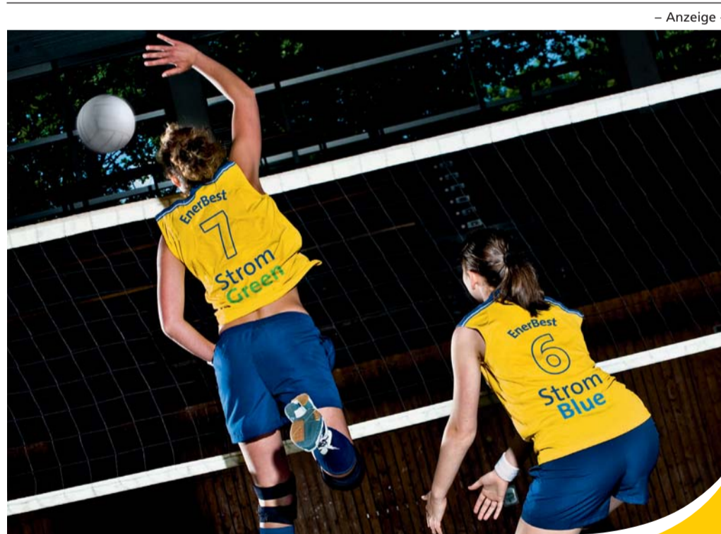
– Anzeige –

Wie berichtet, waren dort zuletzt in der Nacht zum vergangenen Mittwoch 40 Leergutkästen entwendet worden. Deshalb war das Geschäft auch von den Ordnungshütern beobachtet worden. Polizeisprecher Michael Waldhecker: »Die Vierergruppe ist größtenteils geständig und räumt insgesamt drei Diebstähle an der Flachsstraße und fünf Taten im Getränkemarkt an der Salzufler Straße ein.«